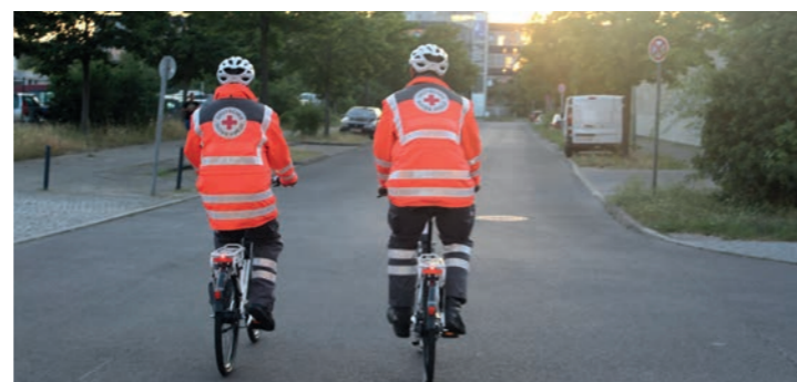
Unsere ehrenamtlichen Helferinnen und Helfer sind für Sie da und unterstützen Sie in dieser Zeit!

Wir wünschen allen Nachbar*innen Gesundheit und Kraft in der aktuellen Lage!