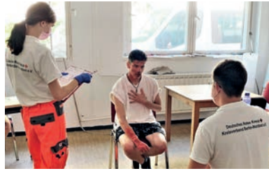
Während der Prüfung

Es ist endlich soweit! Nach coronabedingter Verschiebung der Prüfung konnten unsere angehenden Sanitäterinnen und Sanitäter nun endlich beweisen, was sie drauf haben.