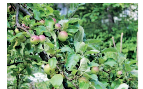
Einige Eindrücke aus unserem Nachbarschaftsgarten